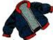
la chamarra la chaqueta